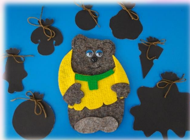
«Что в мешочке?»